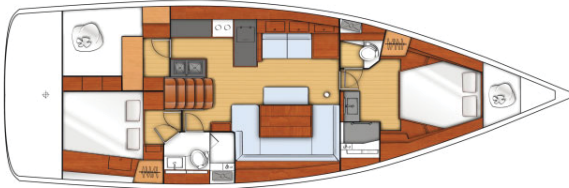
2 cabins - 2 heads / 2 cabines - 2 salles d'eau